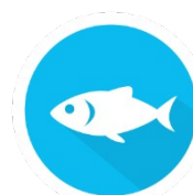
Recursos Marino Costeros