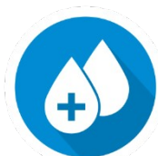
Agua y Saneamiento