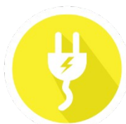
Energía y Transporte