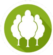
Bosques y Biodiversidad