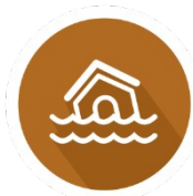
Desastres y Riesgos