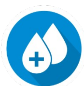
Agua y Saneamiento